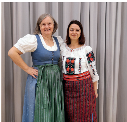
1 Treffen der Trachten aus Absdorf und dem Osten Rumäniens