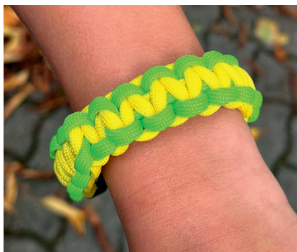
1-6 Coole Ideen vom Jungscharteam machen den Kids großen Spaß.